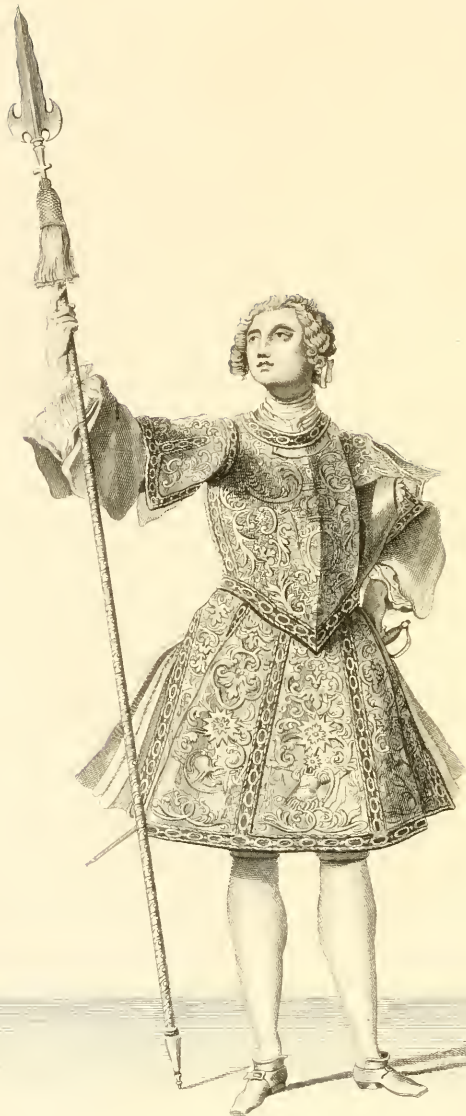
THE BATTLE OF BLENHEIM BY SIR J. VAN DER NEUF 1704